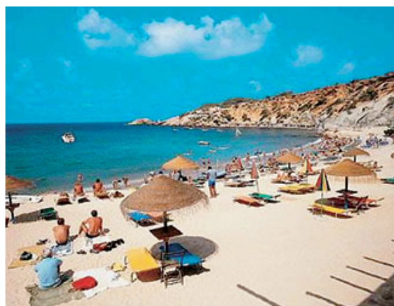
Spiagge di Ibiza

A Ferragosto gli italiani scelgono la Spagna. Costa Brava, Ibiza, Mallorca e Barcellona sono in vetta alla top ten stilata da Logitravel , l'agenzia di viaggi online specializzata in crociere, pacchetti vacanze e hotel al mare, che ha analizzato i dati relativi alle proprie prenotazioni, scoprendo le tendenze e le mete preferite